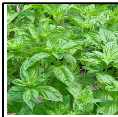
Desenvolvimento da planta